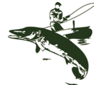
HENGELSPORTVERENIGING DE RIJNSTREEK | WOERDEN

PKF WALLAST ontdek het verschil Accountants & belastingadviseurs