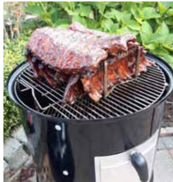
Thuishaven - spareribs zijn hier favoriet!

Dit was in vogelvlucht mijn kennismaking met jou. Leuk om te vertellen, maar ik vind het ook leuk om jouw verhaal te horen. Zie ik je daarom snel op de komende ALV of aan de waterkant?