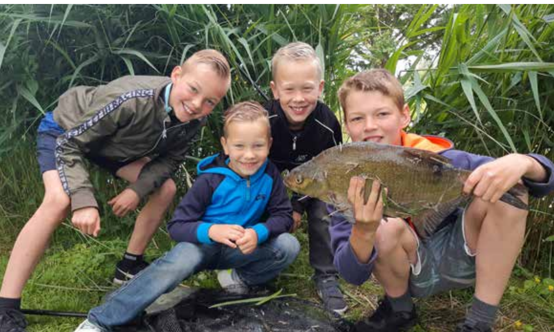
Ook de jeugd kan genieten van een mooie vangst.