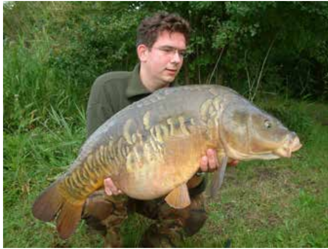
Vinkeveen - één van de meest memorabele vissen die ik ving