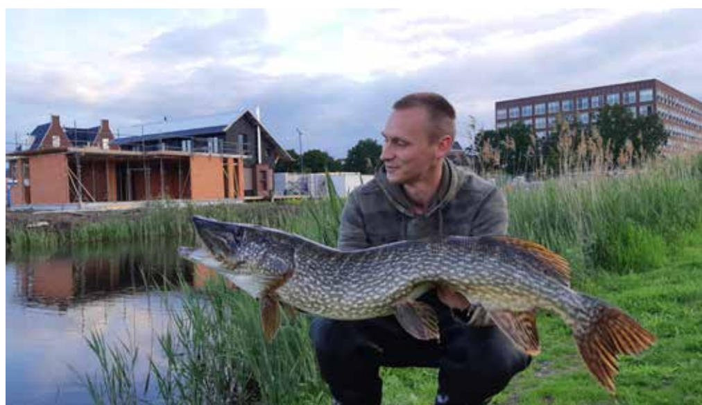
Mooie snoek van de cattenbroekerplas