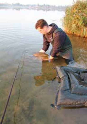
recreatieplas Cattenbroek - behoedzaam wordt ze teruggezet...