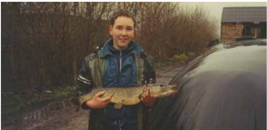
Snoek van 80 cm uit de polder van Kamerik, januari 1994

Het vissen begon bij mij allemaal vanaf dat ik mijn zwemdiploma behaalde. Ik ben eenvoudig begonnen met een bamboehengel. Dagelijks fietste ik uit school zo snel mogelijk naar de waterkant om emmers vol voortjes te vangen. Al snel volgde een mooie telescoophengel van 4 meter en een werphengeltje. Ik ben opgegroeid in het waterrijke Kamerik. Ik heb daar heel wat middagen doorgebracht in de polder om te snoeken en palingen.