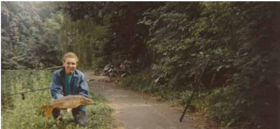
Karekietlaantje in de zomer van 1994

In de Zandgaten zat toendertijd veel karper tot ongeveer 15 pond. Ik verlegde mijn grenzen naar het open water van de Oude Rijn en Grecht, waar ik al snel twintigponders ving en een zelfs een dertigponder. Voor halverwege de negentiger jaren was dit echt een grote vis zeker in onze omgeving.