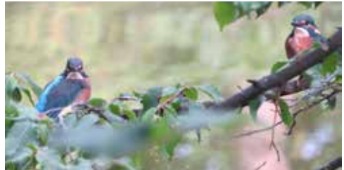
Ijsvogel met jong

Deze foto's zijn genomen boven het viswater van Woerden, namelijk de Zandgaten.