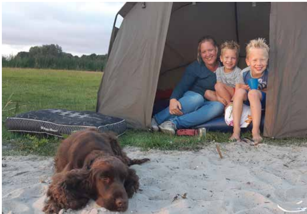
Nachtje vissen in de zomervakantie met het complete gezin

Hopelijk kunnen wij als hengelsportvereniging nog meer jeugd enthousiasmeren om eens een hengeltje uit gooien. Er is toch niks mooier dan buiten zijn en genieten van de rust en natuur?