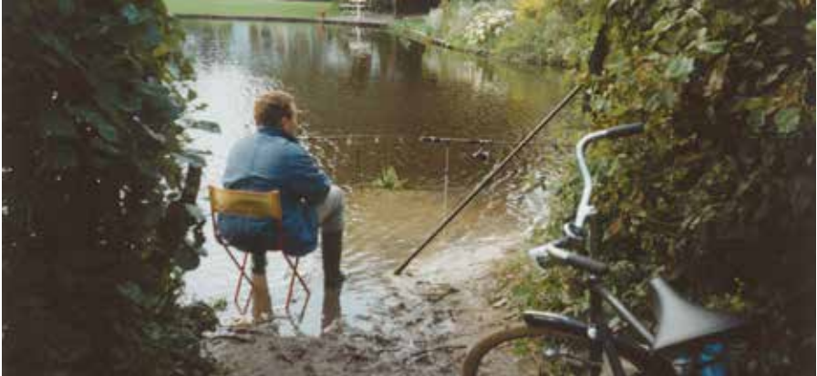
Tweede punt zandgaten 1993

Toen ik het allemaal een beetje doorhad ging ik zelfstandig vissen in de Zandgaten op karper. In het begin toen ik alles nog van mijn zakgeld moest bekostigen, voerde ik met kippenmais en viste daar met een Richworth Cocktail boilie op. Ik zag af en toe wel een boeg golf als er een karper schrok van het tapijt mais op mijn stek! Ik ben toen al snel mijn eigen trouvitboilies gaan maken. Lekker simpel aangemaakt met maismeel, tarwemeel en eieren. Mijn vangsten schoten omhoog, wat ging dat goed!