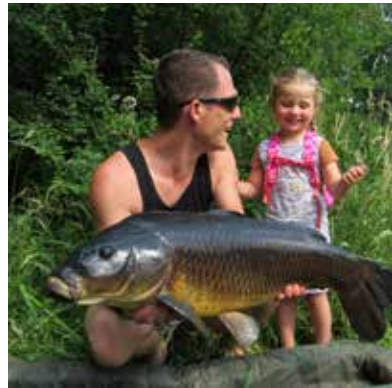
Circa 17 pond

Wat is er mooier dan je hobby delen met je dochter?