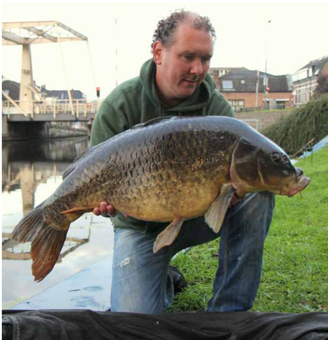
Oude schubkarper, september 2018

In Nederland viste ik inmiddels vanaf een kajuitboot op de Vinkeveense Plassen. Wat een prachtig en visrijk water is dat! Ik heb er 10 jaar gevist gemiddeld zo'n 2 nachten in de week. Op gegeven moment was ik er wel een beetje klaar mee omdat het zoveel tijd in beslag nam. Elke avond ging ik heen en weer om te voeren! Ik heb mijn boot een aantal jaar geleden verkocht maar af en toe begint het toch wel weer te kriebelen.