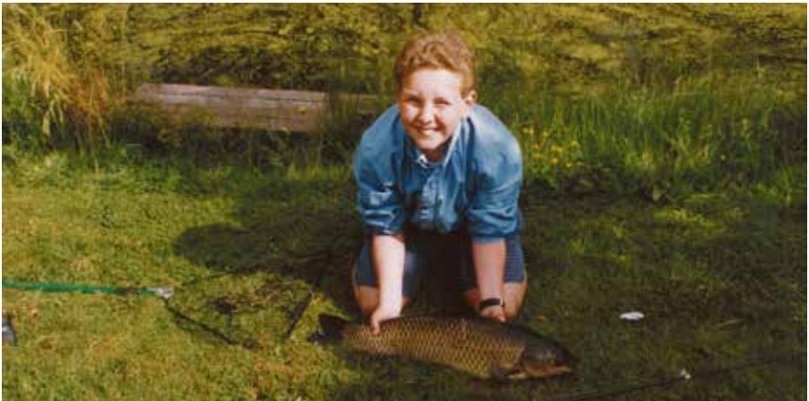
Graskarper van 70cm en 9 pond - mei 1990