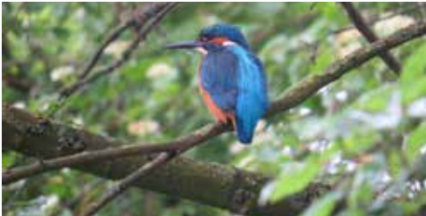
Ijsvogel bij de zandgaten