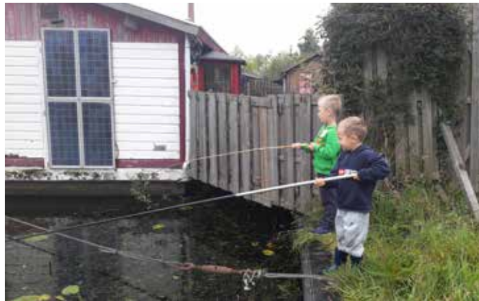
Voormpjes tikken, daar begint het mee