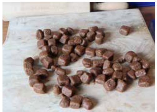
Resultaat: boilies voor maar € 2,50 per kilo