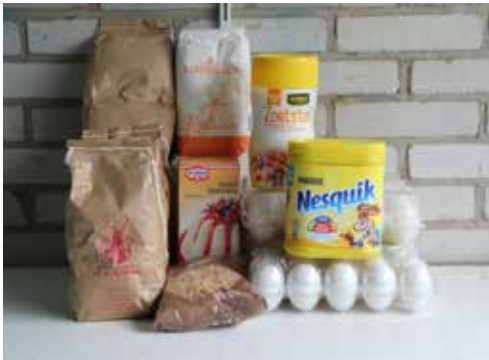
Alle ingrediënten voor een chocopeanut boilie