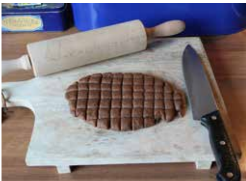
Gereedschappen gebruiken we gewoon uit de keuken