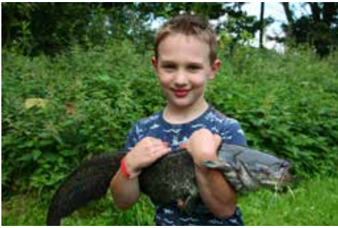
Serieuze meerval. Tegenwoordig komen ze steeds meer voor.