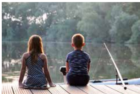
Genieten aan de waterkant