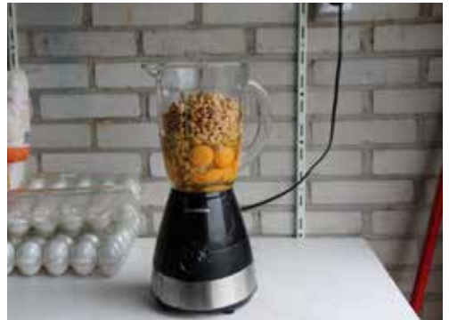
Pinda's vermalen we in de blender samen met de eieren